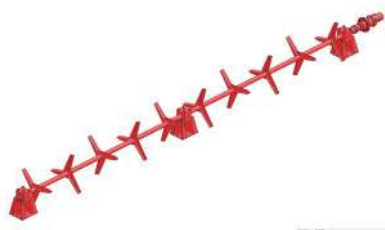
AGITADOR INTERNO HIDRÁULICO