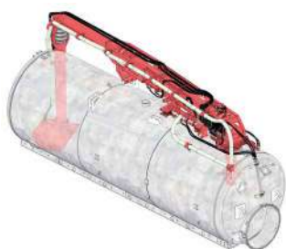
BRAÇO SUPERIOR 3 ARTICULAÇÕES COM KIT DE PURGA, TINA DE RETENÇÃO E SIFÃO PRIMÁRIO

Para qualquer equipamento, temos disponíveis vários opcionais com os quais pode equipar o seu produto standard. Neste caso, destacamos uma vasta gama de bombas compressoras/depressoras (STAR, PN e DL), sistemas de canhão orientável (GARDA, JULIA e ITALA), braços de carga laterais e superiores, aceleradores de carga e localizadores Vogelsang ou Herculano.