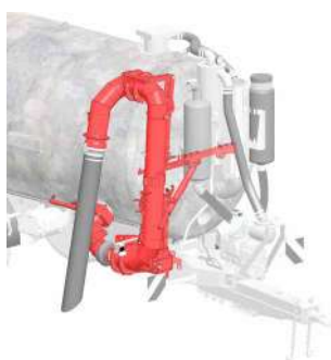
BRAÇO HIDRÁULICO COM 2 ARTICULAÇÕES, TAMANHO S M, L E XL