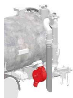
ACELERADOR DE CARGA NA SAÍDA DA ADUFA